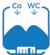
Pesatura degli ingredienti